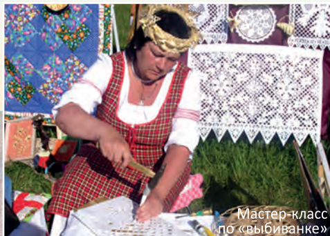
Мастер-класс по «выбиванке»

Экскурсии, мастер-классы по традиционным видам ремёсел: соломоплетение, лозоплетение, аппликация, изготовление изделий из бумаги (выбиванка), плетение поясов, ткачество, пэчворк. Традиционные сувениры (изделия из соломки и лозы, плетёные пояса), сделанные руками лучших мастеров Новогрудчины.