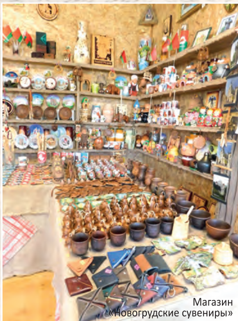
Магазин «Новогрудские сувениры»

Традиционные сувениры (изделия из соломки и лозы, плетёные пояса), сделанные руками лучших мастеров Новогрудчины, вы сможете приобрести в Новогрудском районном центре ремёсел , ул. Чапаева, 13, тел. (8-01597) 41541, 22470, www.nov-centr.of.by .