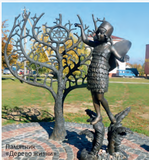
Памятник «Дерево жизни»

г. Новогрудок, ул. Минская, 68, тел. (801597) 44916.