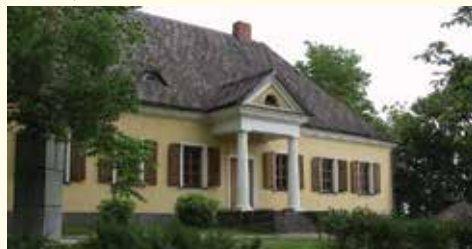
График работы: ежедневно 9.00-18.00 без обеда. Выходной – понедельник и государственные праздники