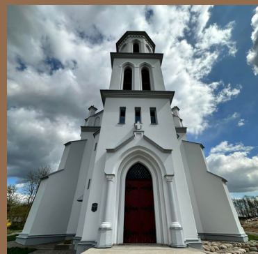
Костел Св. Казимира во Вселюбе