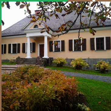
Дом-музей Адама Мицкевicia