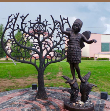
Музей еврейского сопротивления